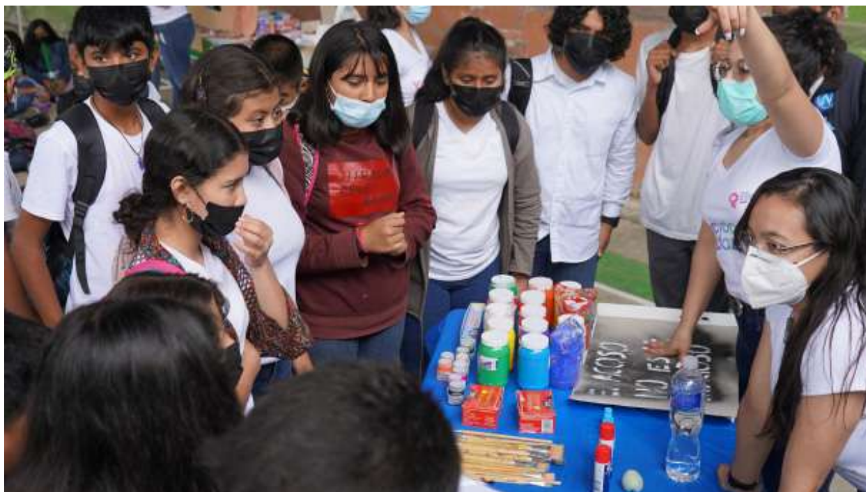
Feria de Salud en Marcala, La Paz

tras”; a 46 madres y maestras a través de los talleres “Prevenir en las escuelas para transformar” y a 460 estudiantes a través de ferias de salud.