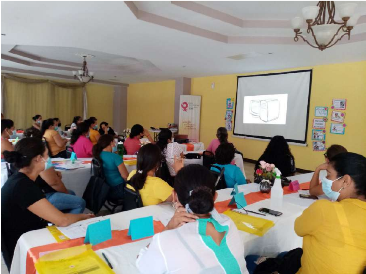
Escuela de Liderazgos Asertivos