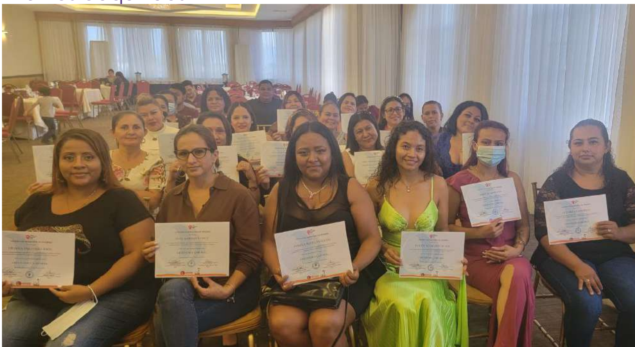
Graduación de la escuela de Defensoría Laboral

La Escuela de Defensoría laboral es un proceso formativo, este año se logró la participación de 27 defensoras/promotoras legales de la maquila, desarrollando 5 módulos sobre derechos laborales con enfoque de género, y se espera que en los próximos años se desarrollen acciones de replica y multiplicación de los conocimientos adquiridos.