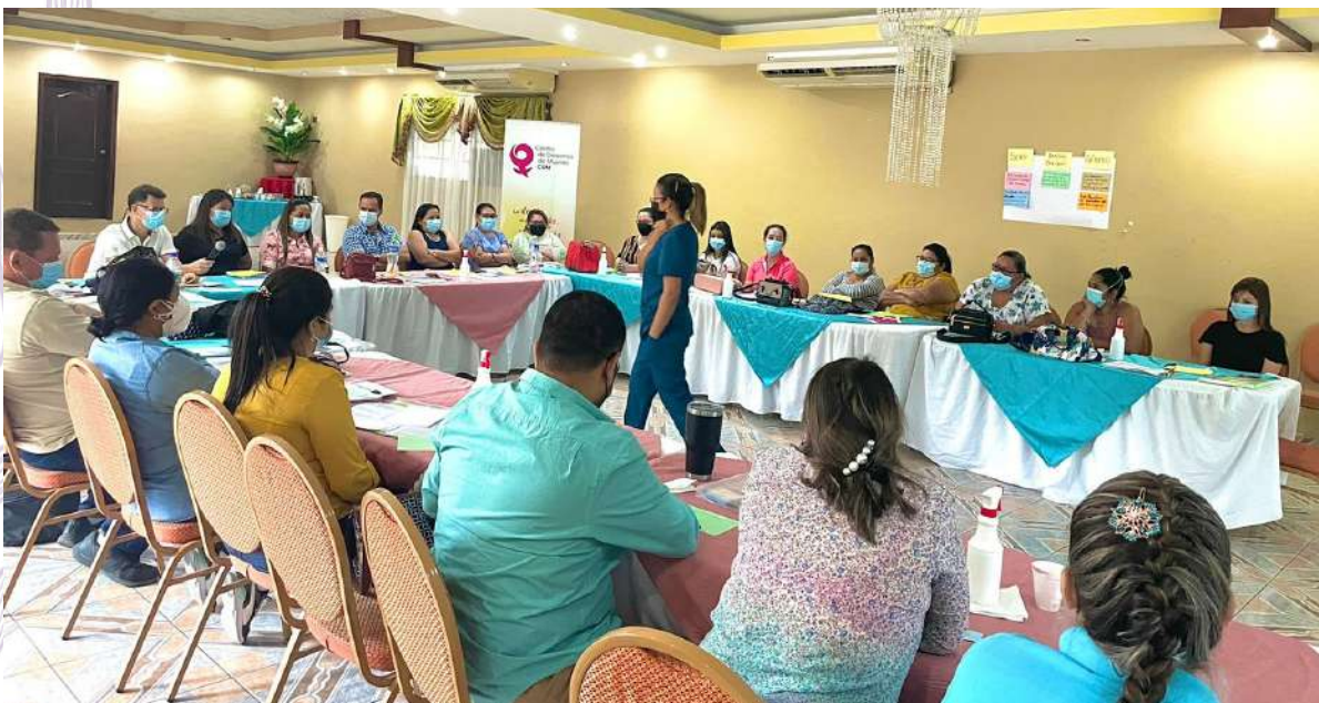
Proceso Formativo con Personal de Salud

Desde el programa Construcción de Ciudadanía de las mujeres, para fortalecer las capacidades de conocimiento del personal de salud, en las temáticas relacionadas con los derechos humanos de las mujeres y su derecho a la salud y a una vida libre de violencias. En 9 municipios del Departamento de Santa Bárbara se realizó un proceso formativo conformado por 3 módulos: Derechos humanos de las mujeres, Violencia contra las mujeres y Derechos sexuales y reproductivos, con la participación de 20 personas (16 mujeres/ 4 hombres).