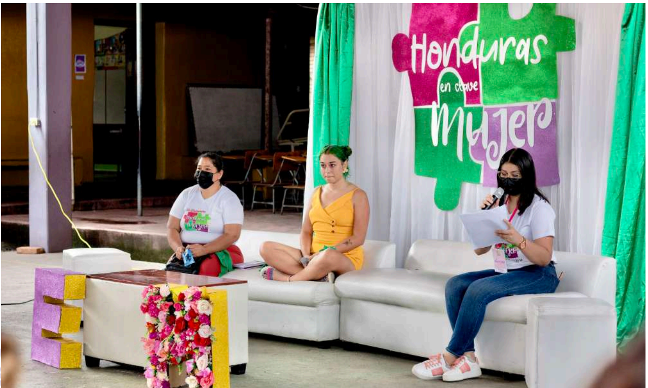
Encuentro en Clave Mujer 2022 - Choluteca