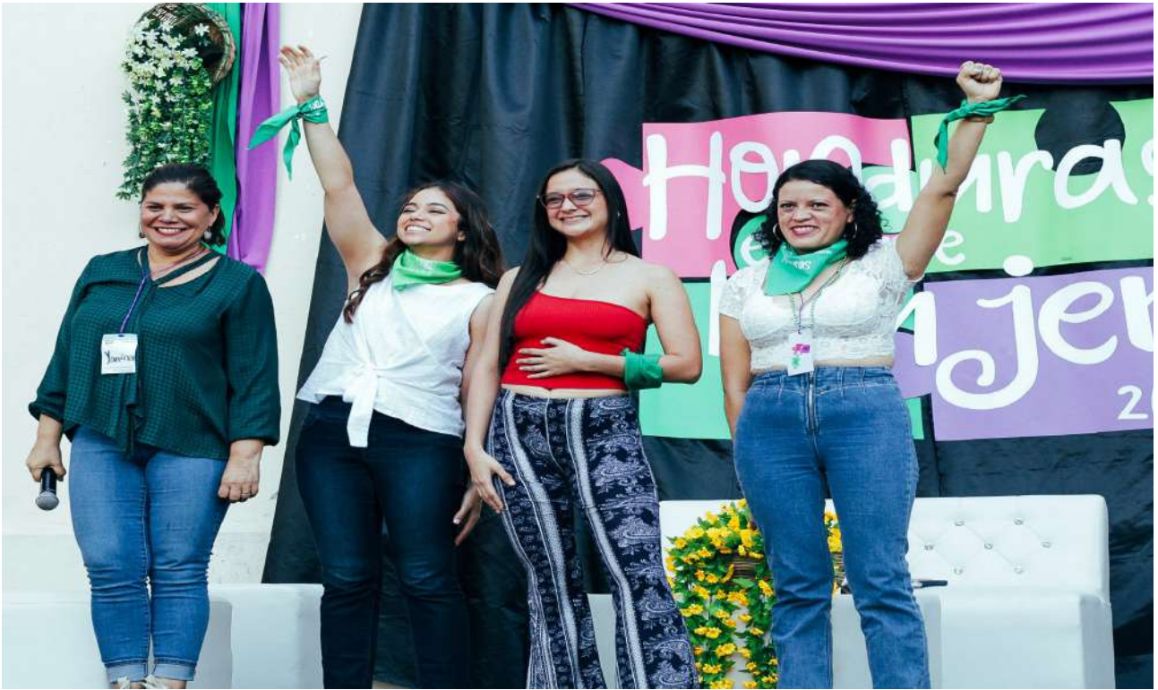
Encuentro en Clave Mujer 2022 - San Pedro Sula