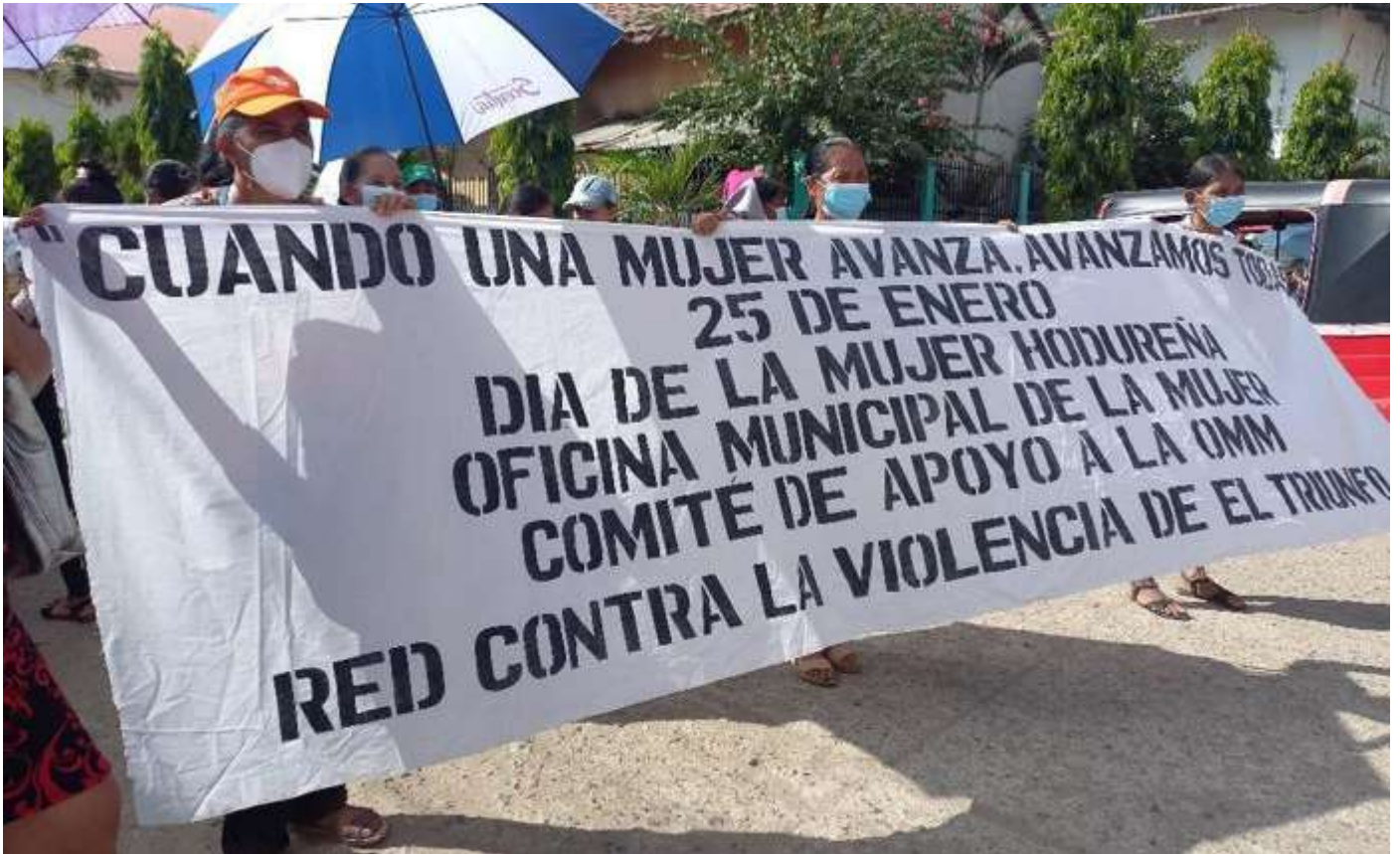
Caminata en el marco del Día de la Mujer Hondureña