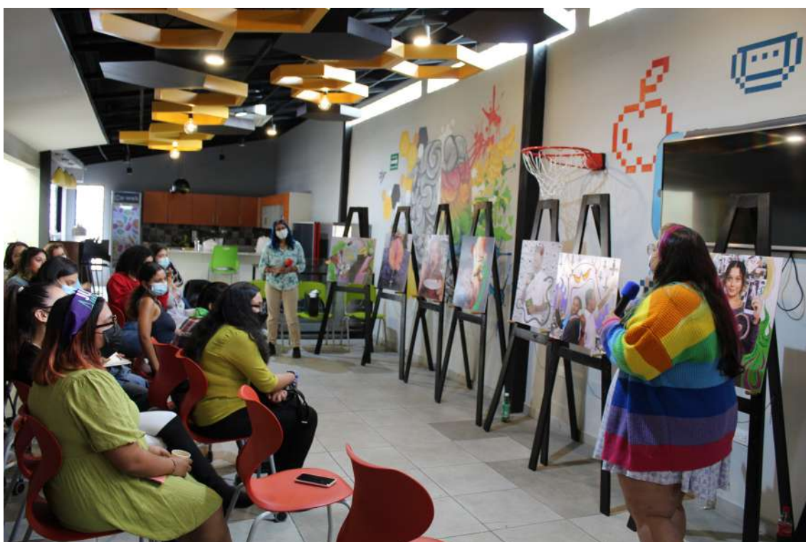
Clausura del Ciclo de Laicidad

Las participantes realizaron trabajos finales (escritos y artísticos).