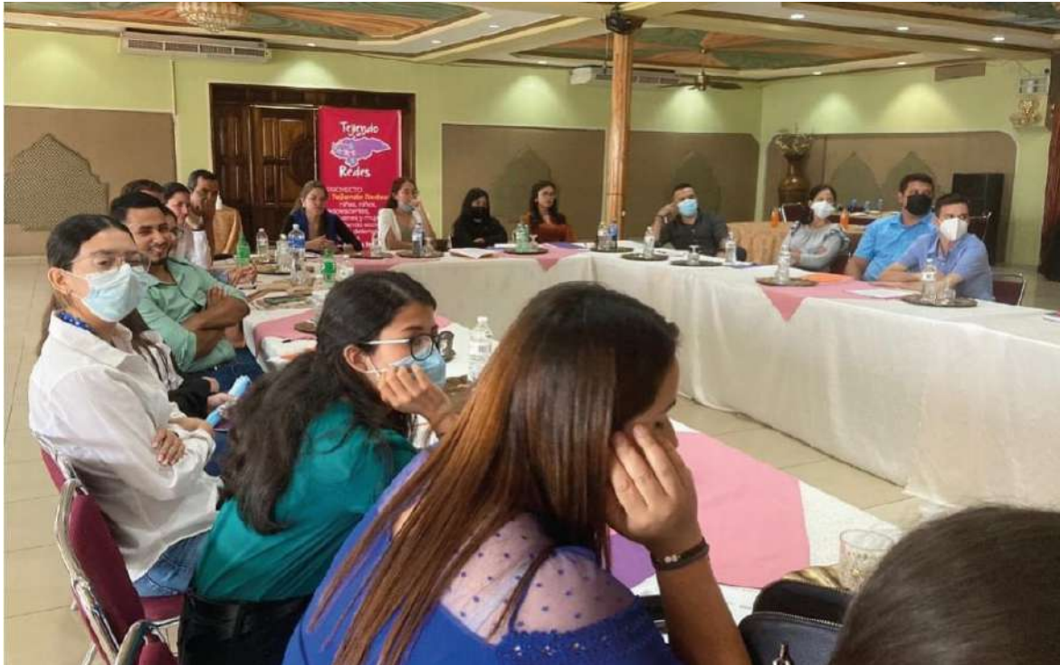
Formación con procuradores de justicia de la UTH

Se realizaron dos procesos de formación, uno con operadores de justicia de Santa Bárbara (21 participantes y de estos, 5 mujeres) y otro con procuradores legales de 2 campus de UTH: Santa Bárbara y Siguatepeque (25 participantes, 17 mujeres). La temática giró alrededor del marco legal de protección de los derechos de las mujeres y violencias contra las mujeres. Se seleccionaron procuradores legales para que integren los consultorios jurídicos móviles y se proporcionaron 32 orientaciones legales.