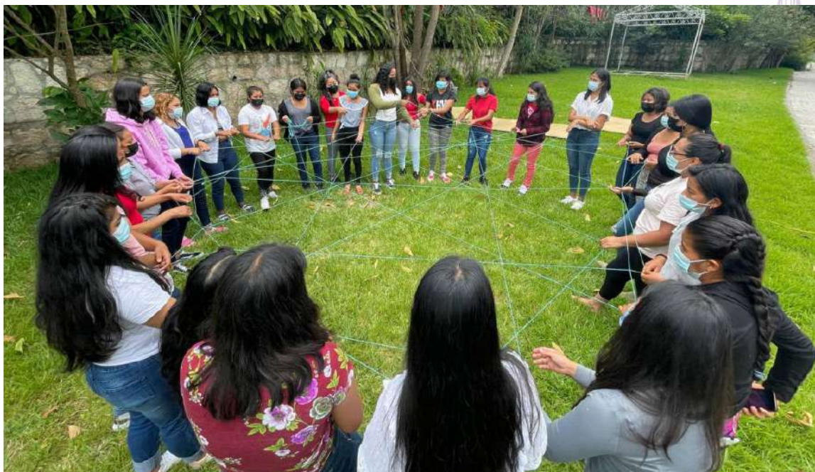
Campamento de jóvenes