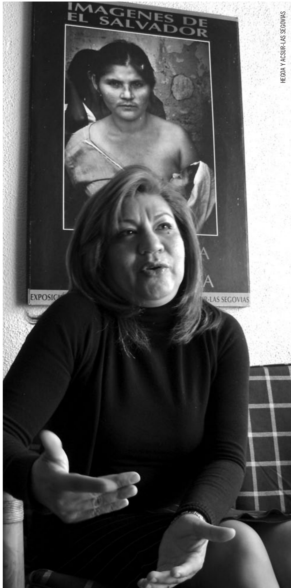
HEGOA Y ACSUR-LAS SEGOVIAS

concordancia con el cumplimiento de derechos económicos, sociales y culturales y en segundo lugar, precarizan más las condiciones de trabajo, sin necesidad de reformar códigos de trabajo ni constituciones. El dominio que tienen hace que se dé una violación sistemática de los derechos laborales.