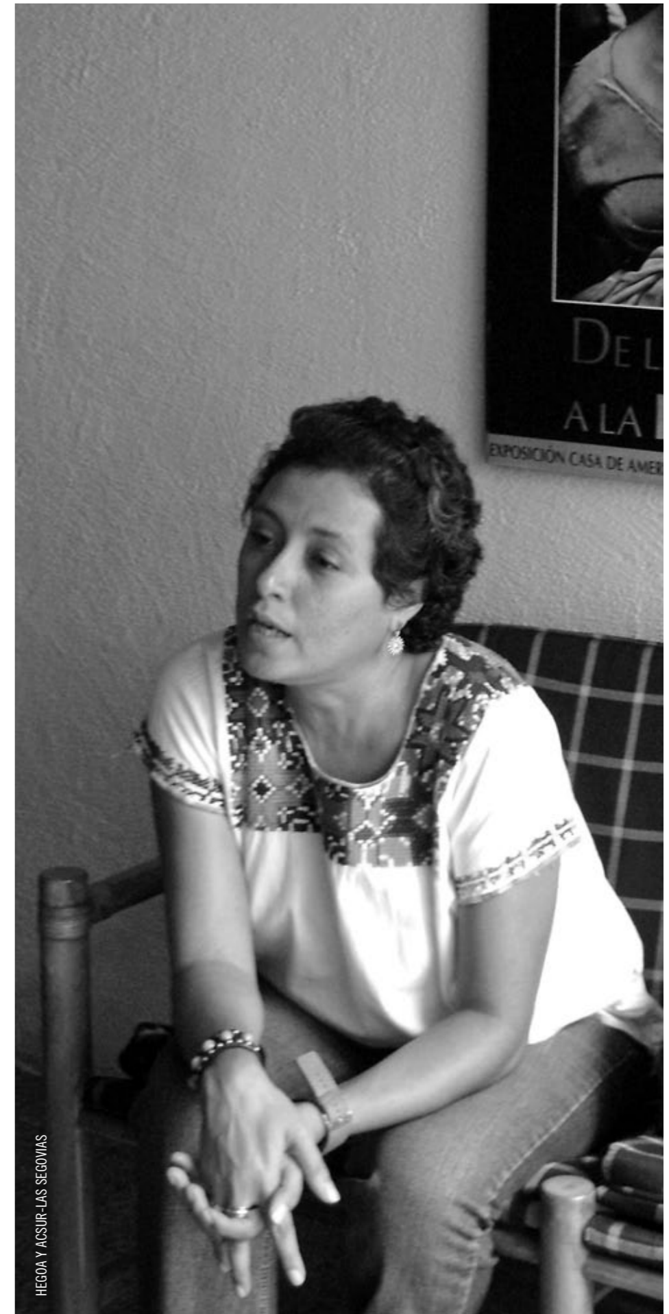
HEGOA Y ACSUR-LAS SEGOVIAS

Nosotras tenemos relación con FEASIES, (Federación de Asociaciones o Sindicatos independientes de El Salvador), federación sindical que está comenzando un proceso de construcción de un enfoque de género dentro de su estructura y trabajo, y la secretaria general, que es una mujer, impulsa el tema de reivindicaciones propias de las mujeres dentro del