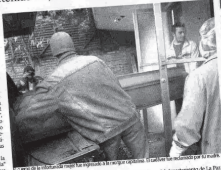
El cuerpo de la infortunada mujer fue ingresado a la morgue capitalina. El cadáver fue reclamado por su madre.

La madre dijo que se enteró de la muerte de su hija