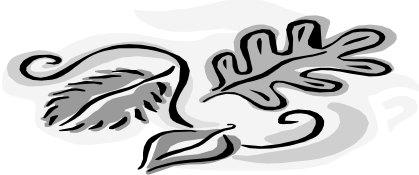
Feministas en resistencia Boletín I

Porque creemos en la democracia y rechazamos el golpe de Estado enmascarado como “sucesión Presidencial”. Estamos a favor de los derechos para elegir y ser electos/as. Creemos en la libertad que tenemos como personas, creemos en la dignidad humana, en la fuerza, la solidaridad y la esperanza. Por lo tanto: Decimos NO al Estado de sitio, al toque de queda, a la brutalidad y represión del ejército.